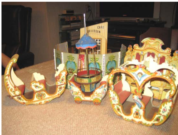
Onderdelen van de draaimolen en de schuitjes