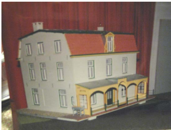
Hotel café Driessen