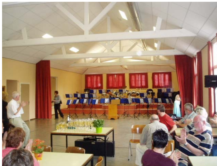
Het theatergordijn wordt geopend voor een blik op de nieuwe muziekstandaards en klappers. Applaus !