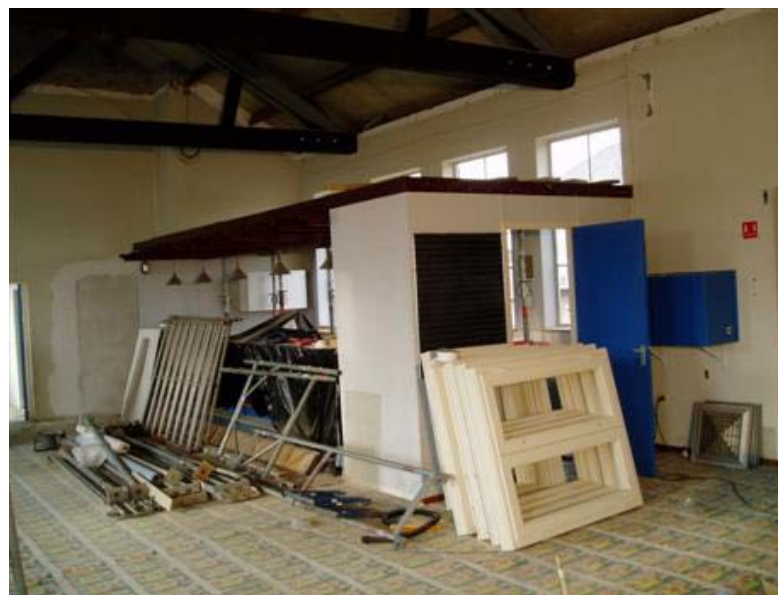
Werk in uitvoering !