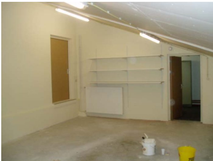
Veel, veel extra opbergruimte, en dat komt goed van pas !