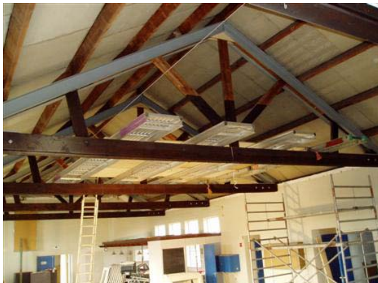
Steigerconcert bij Wilhelmina???