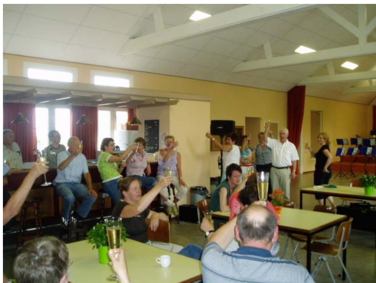
Proost op Wilhelmina !