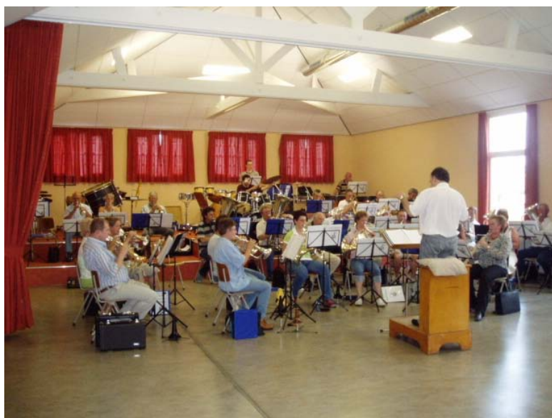
Geweldig ge♫♫♫♫, wat een ruimte !