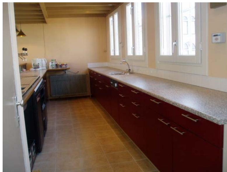
De prachtige nieuwe keuken.