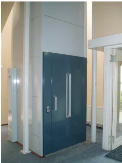
Voortaan kan er gelift worden aan de Kloosterstraat !