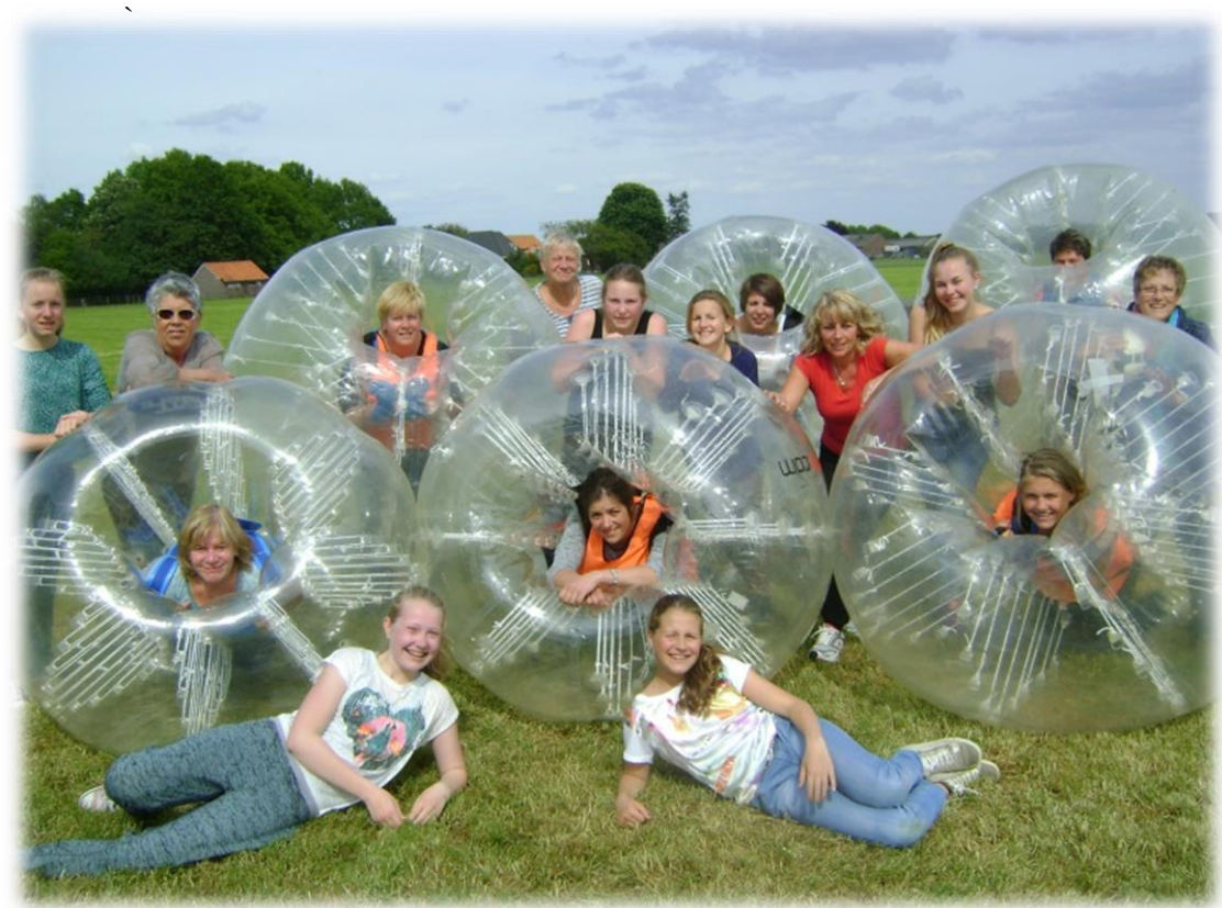
Het complete Bubble- Ball team!