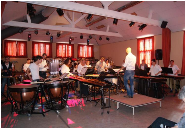
Malletband van muziekvereniging Excelsior in actie.