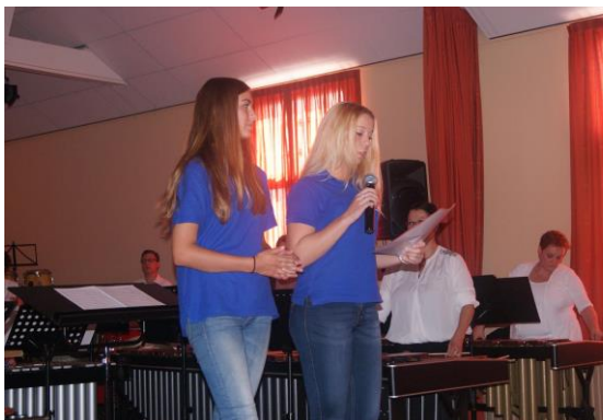
De presentatrices van het slagwerkfestival